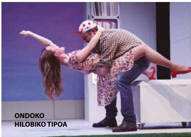
ONDOKO HILOBIKO TIPOA